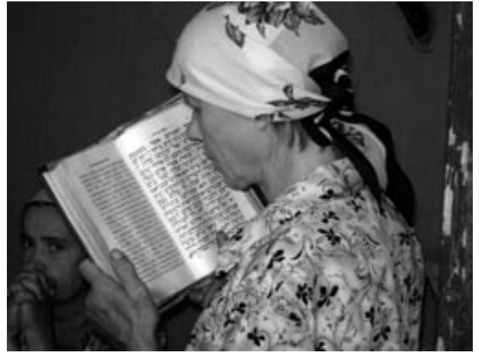
אוקריינישע פֿרויען בײַ אַ רבין אין טשערנאוויץ פֿאַטאָ פֿון אלאן שאַרבאַנעל.