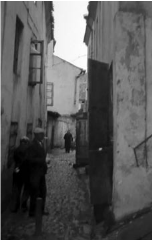
א בילד פון מעטשים בראזאטיס

אין דער ייִדישער קהילה 1 אין ווילנע 2 איז דעם זומער געווען אַ פּאָטאָגראַפֿישע אויסשטעלונג 3 פֿון מעטשים בראַזאַטיס 4 , אַ ליטווישער אַוויאַציע־קאַפיטאַן וואָס האָט פּאָטאָגראַפֿירט ווילנער ייִדן אין יאָר 1940, איין וואָך איידער די רויטע אַרמיי האָט צום צווייטן מאָל פֿאַרנומען די שטאָט. דבֿורה 5 קאַצאַוויטש פֿון בוענאָס־אַרעס, וואָס איז דעם זומער געווען אין ווילנע אויפֿן זומער־פּראָגראַם, און וואָס איז אַליין אַ פּאָטאָגראַפֿין, האָט אונדז צוגעשיקט די דאָזיקע קורצע דערציילונג.