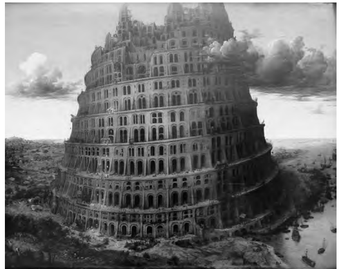
אויבן : דער בבל-טורעם, בילד פֿון פיטער ברויגעל דעם עלטערן (ארום 1568). לינקס : טל חבֿר-כיבאָווסקי.

אינעם קומענדיקן נומער וועלן מיר געבן נאָך אַ פֿאַר שפּראַך-עצות פֿאַר ייִדיש-לערנערס וואָס קענען דײַטש, דאָס מאָל וועגן גראַמאַטיק, סינטאַקס און וואַקאַבולאַר.