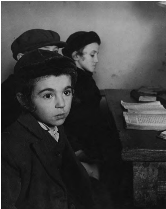
אויבן : בילד פֿון ראָמאַן ווישניאַק. רעכטס : פלאַקאַט פֿון דער אויסשטעלונג.

איר קענט דעם פֿאַטאָגראַף ראָמאַן ווישניאַק ? אַוודאי 2 קענט איר, ער איז וועלט באַרימט 3 . דאָס האָט ער געשאַפֿן די פרעכטיקע 4 פֿאַטאָגראַפֿען זאַמלונג אַ פֿאַרשוואַנדענע וועלט 5 , מיט בילדער פֿונעם יידישן לעבן, אַראָפּגענומען אין די שטעט און שטעטלעך פֿון מזרח-אײראָפּע אין די יאָרן 1935–1938. אָבער אַ דאַנק דער אויסשטעלונג 6 אינעם יידישן מוזיי אין פֿאַריז דערווייט מען זיך אַז דאָס איז נאָר אַ קליינער טייל פֿון זײַן שאַפֿונג. די אויסשטעלונג הייסט : „ראָמאַן ווישניאַק – פֿון בערלין ביז נײַ-יאָרק (1920–1975)“ און איר צוועק 9 איז צו געבן אַן אַרומנעמיקן 10 בליק אויף דער קינסטלערישער שאַפֿונג פֿון זײַן גאַנץ לעבן.